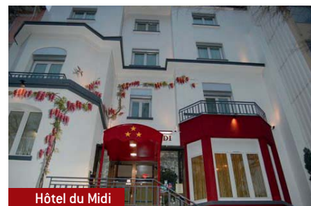
Hôtel du Midi

Nous cherchions aussi une exploitation qui soit d'une dimension raisonnable pour nous permettre de mener une vie de famille. L'Hôtel du Midi était le produit qu'il nous fallait et nous avons ré- investi en travaux 300 000 euros. Nous avons estimé le retour sur ré- investissement à l'issue de la 3 ème année d'exploitation. » explique cet entrepreneur.