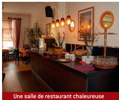
Une salle de restaurant chaleureuse