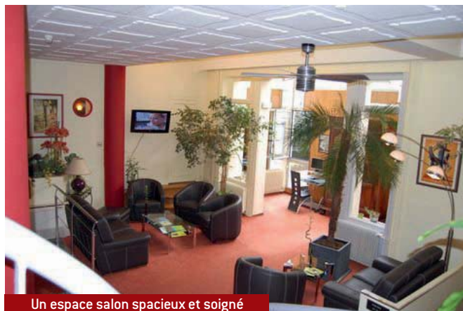
Un espace salon spacieux et soigné

Ils ont uni leurs savoir-faire pour s'engager dans l'hôtellerie en reprenant tout d'abord un complexe hôtelier de 2000m 2 avec 25 chambres à côté de Saumur dans le Maine et Loire. Puis en septembre 2007, après avoir vendu cette affaire depuis plusieurs mois, ils saisissent une opportunité dans la région stéphanoise. « Nous recherchions cette fois-ci une affaire à redynamiser orientée « business » et où nous aurions à intervenir pour créer une ambiance personnalisée.